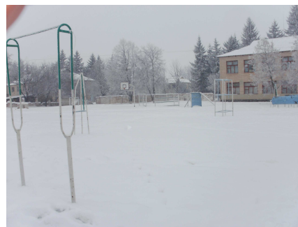
Зимовий пейзаж шкільного подвір'я